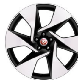
20" KOLA S 6 PAPRSKY DIAMOND TURNED (STYLE 6007)