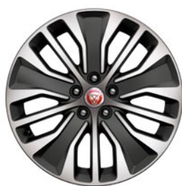
18" KOLA S 5 DVOJ. PAPRSKY DIAMOND TURNED (STYLE 5055)