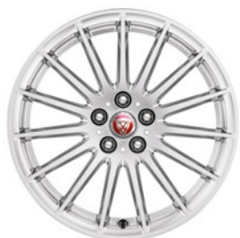
18" KOLA S 15 PAPRSKY (STYLE 1022) Standardní výbava pro I-PACE S