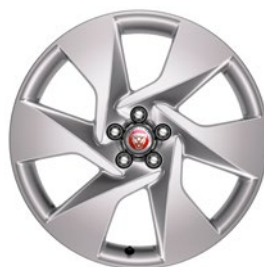
20" KOLA S 6 PAPRSKY (STYLE 6007) Standardní výbava pro I-PACE SE