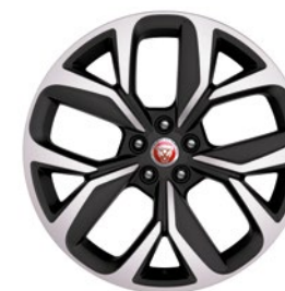
20" KOLA S 5 PAPRSKY DIAMOND TURNED (STYLE 5068) Standardní výbava pro I-PACE HSE